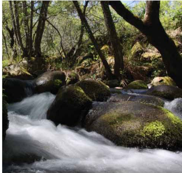
Los meandros del Duero salpican el trayecto. Abajo, el Parador de Ciudad Rodrigo.

Tomando el mismo rumbo que el río Tormes ha marcado desde Salamanca, nos reencontramos con las suaves paisajes del Campo Charro. Ahora se suceden las onduladas planicies de la dehesa salmantina donde se asientan entre dispersos