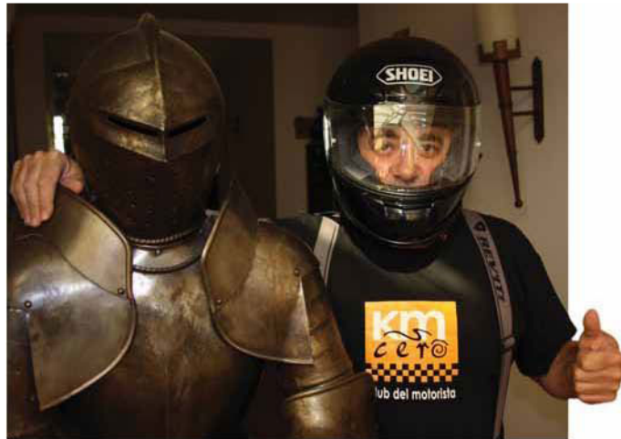
Pasado y presente se dan la mano en Paradores.