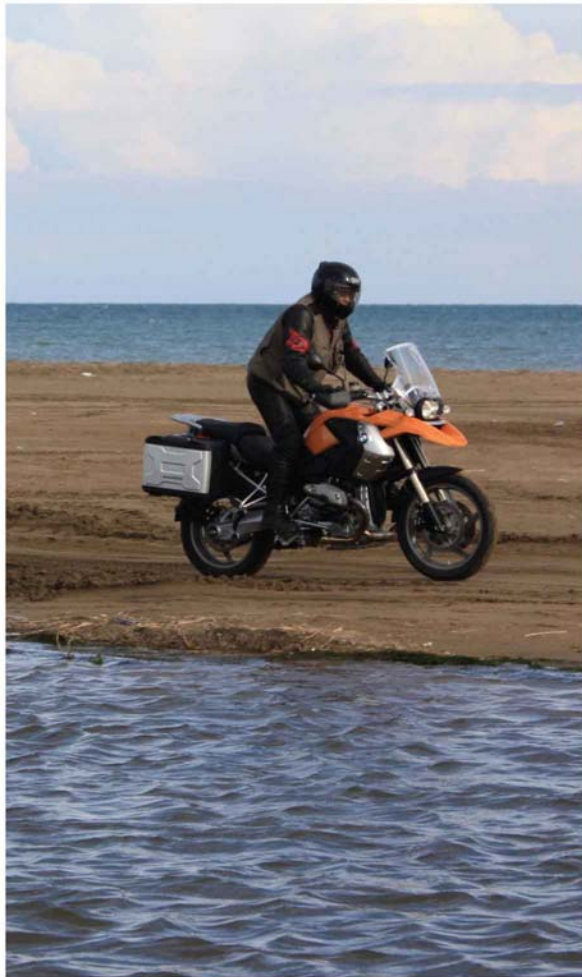
Delta del Ebro.

» los macizos montañosos de la Reserva Natural de Puertos de Beseit a nuestra derecha, nos obligan a retomar su compañía y a hacer otro alto a su vera, en la ciudad de Tortosa.